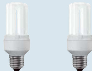
12 V DC VARIO12 V